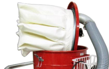
Tetratex-tähtisuodatin 2 m 2

Eurovac 53 – teollisuusimurit ovat myös huomattavan kevyitä verrattuna turbiini-imumoottorisiin teollisuusimureihin.